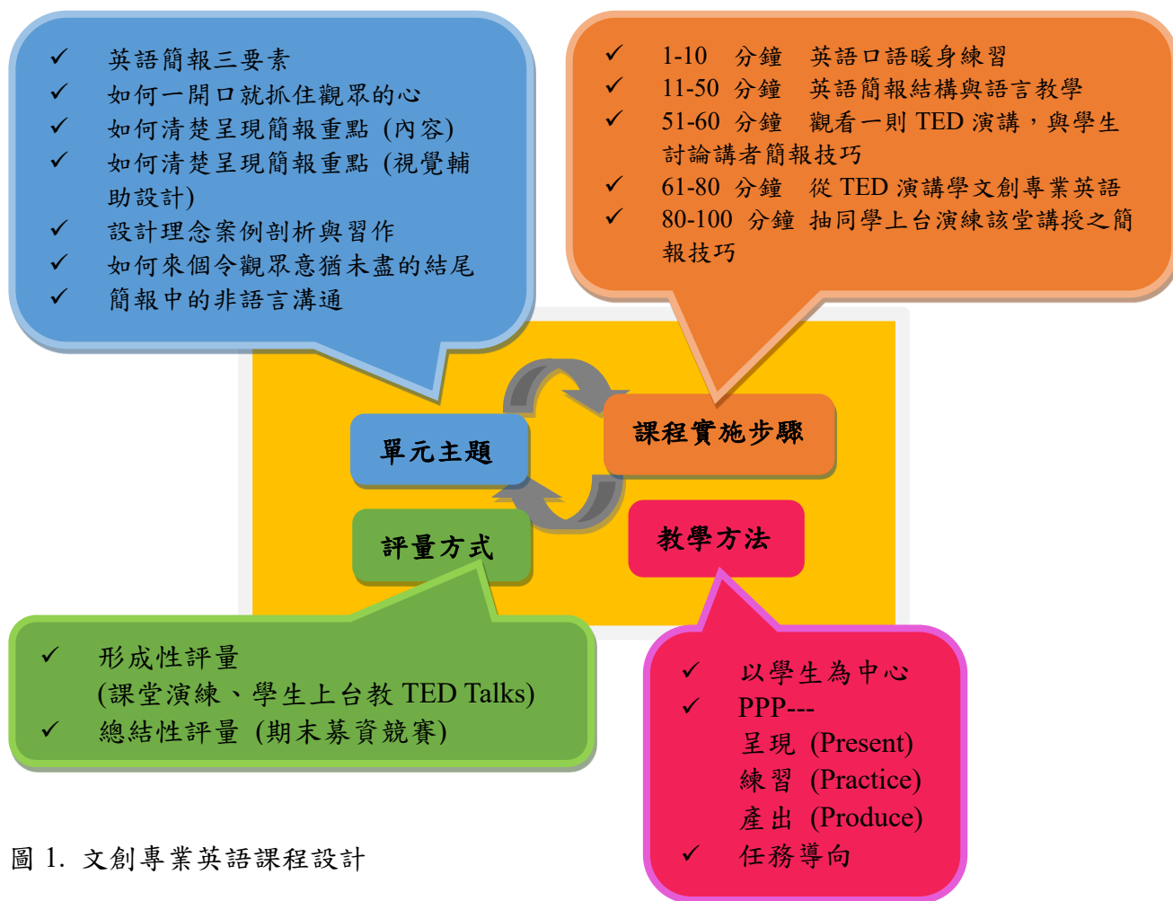
圖 1. 文創專業英語課程設計